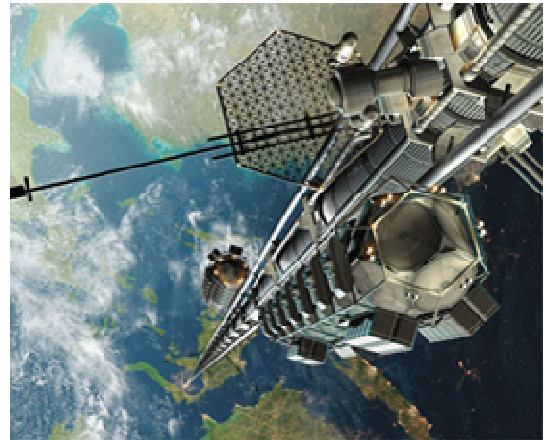
Dessin d'artiste représentant un ascenseur spatial

La particularité de l'orbite géostationnaire suggère une façon de relier le sol et l'espace : il suffit de laisser pendre un câble d'un satellite géostationnaire. Ce dernier restera toujours à l'aplomb du même point de la surface terrestre d'où l'on pourra construire une base de départ de cabines qui escaladeront le câble, transportant des satellites