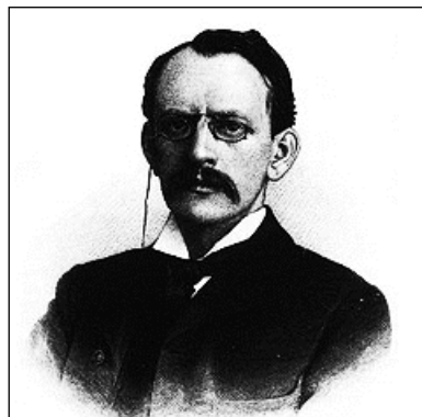
Joseph John Thomson (1856 -1940), physicien anglais