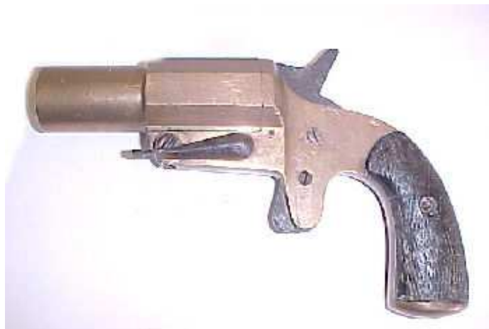
Pistolet lance-fusées (d'après www.histoire-collection.com )

Ainsi les pistolets signaleurs se sont avérés très utiles.