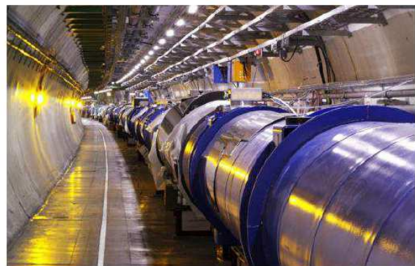
Vue intérieure du LHC

On fait circuler des paquets d'ions dans les deux sens. Ils entrent en collision frontale à une vitesse proche de celle de la lumière dans le vide : cette collision produit des bosons de Higgs. Leur durée de vie étant très brève, ils se désintègrent immédiatement en une multitude de particules. Ce sont ces particules qu'on détecte par l'expérience. Entre 2008 et 2011, 400 000 milliards de collisions ont été enregistrées. Une particule d'énergie de masse au repos d'environ 125 GeV a été détectée, avec un degré de confiance de 99,999 97 % : le boson de Higgs !