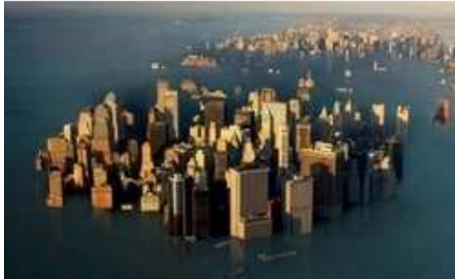
Vue d'artiste de New-York sous les eaux

Le but de cet exercice est d'évaluer l'évolution du niveau des océans en lien avec l'augmentation de la température de l'atmosphère terrestre.