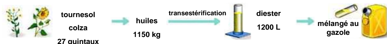
Schéma de la chaîne de fabrication d'un carburant à base de Diester®

Développé dans les années 80, le Diester® (marque déposée provenant de la contraction de « DIESeI » et « eSTER ») est le nom donné au premier agrocarburant issu essentiellement de la transformation des huiles de colza et de tournesol, végétaux cultivés en France.